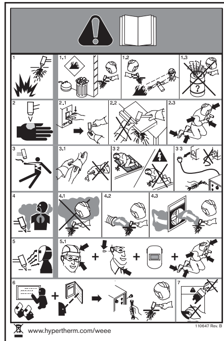
CE safety label